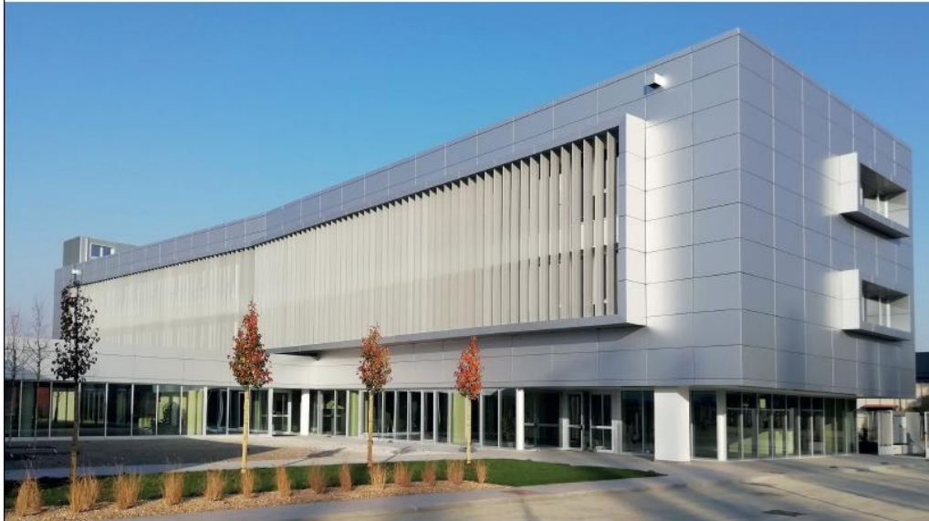
SEA VISION STA LAVORANDO INTENSAMENTE AL FIANCO DEI PRODUTTORI DI VACCINI IN TUTTO IL MONDO

S e tutti i riflettori del mondo sono ora rivolti verso i vaccini contro il Covid, cui è legata la risoluzione della pandemia globale che sta investendo tutto il mondo, ne sa qualcosa l'azienda pavese SEA Vision, che produce da 25 anni sistemi di visione per l'industria farmaceutica e che si trova in questi mesi a fianco dei clienti per produrre ed installare più velocemente possibile i sistemi di controllo sulle linee di produzione dei vaccini. Tutte le principali aziende che stanno sviluppando tali vaccini, dall'Italia alla Russia, dal Belgio alla Francia stanno infatti utilizzando le tecnologie sviluppate a Pavia, ed è una corsa contro il tempo per assicurare a tutti i clienti i sistemi e l'assistenza continua per poter produrre nel modo più efficace possibile. Per l'azienda pavese è un anno particolarmente impegnativo ed importante, perché questo carico di lavoro straordinario è andato a sommarsi alla costruzione di una nuova sede, ed a importanti investimenti, il tutto in pieno lockdown. L'azienda, nonostante la congiunzione, ha reagito sviluppando nuove modalità di lavoro da remoto, e riuscendo così a proseguire nello sviluppo di nuove soluzioni tecnologiche e ad assistere i clienti pur nelle difficoltà logistiche ed operative. L'avventura di SEA