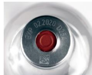
SEA VISION GARANTISCE LA CONFORMITA' E LA TRACCIABILITA' DEI FARMACI